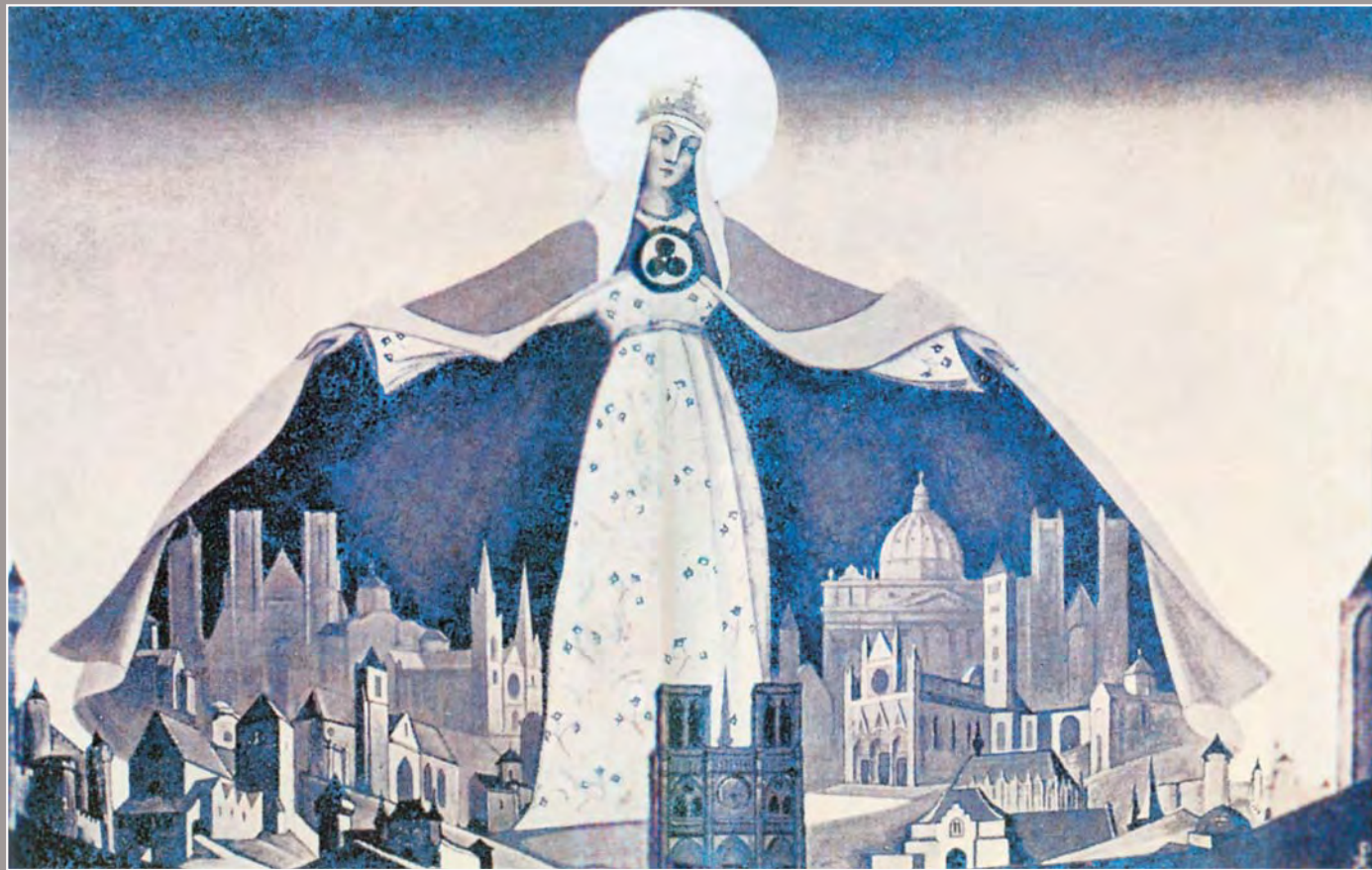
121. Н.К. Рерих. Мадонна Защитница. 1933