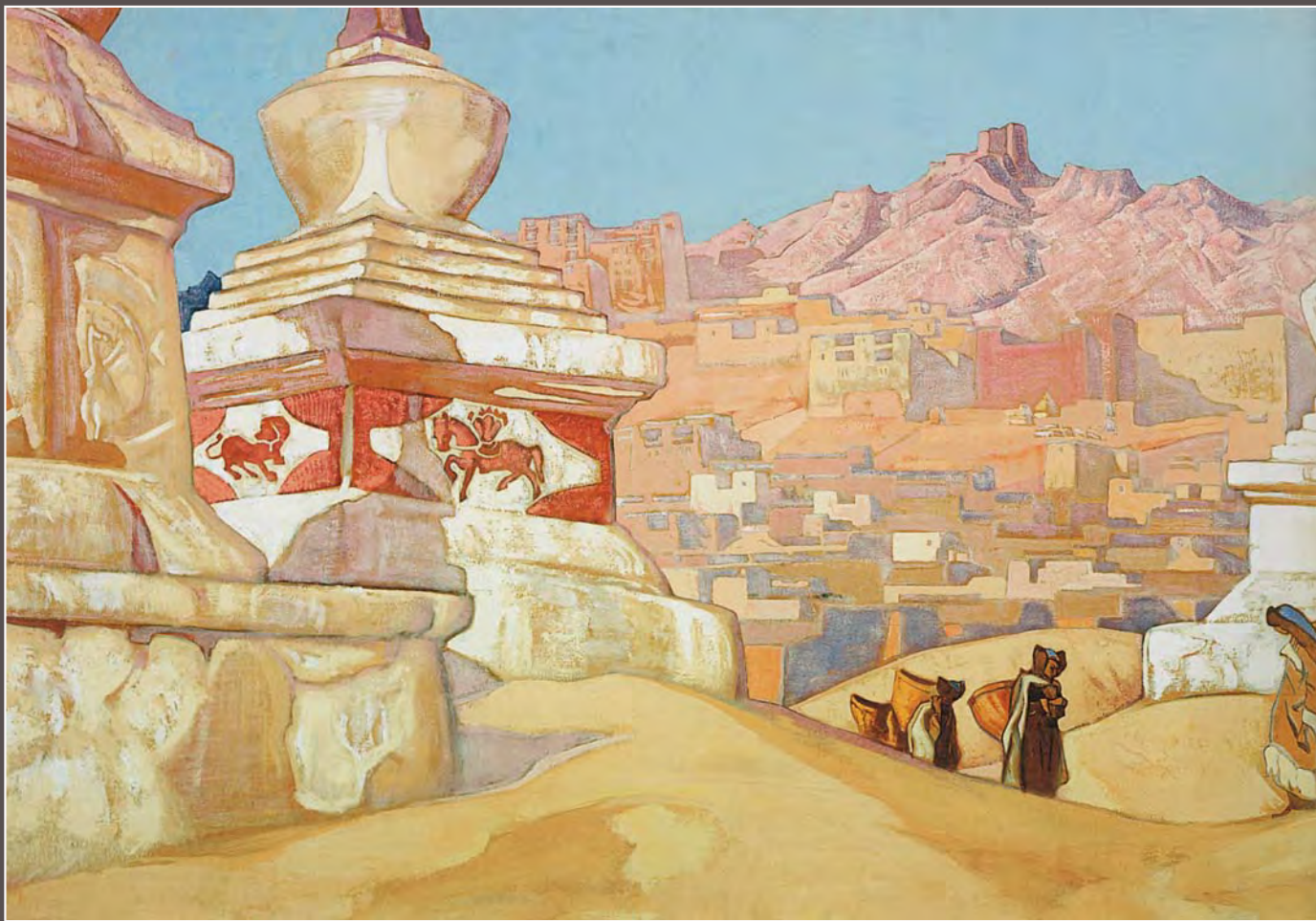
112. Н.К. Рерих. Конь счастья. Из сюиты «Майтрейя». 1925