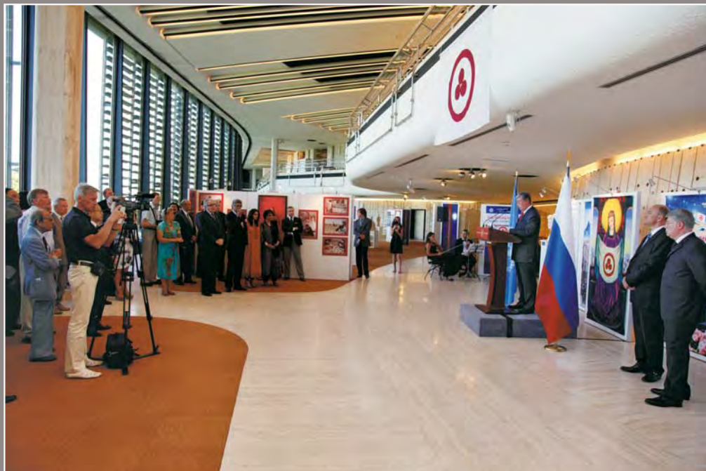
125. Открытие выставки «Пакт Рериха. История и современность» во Дворце Наций. Отделение ООН в Женеве, Швейцария. 12 июня 2013 года