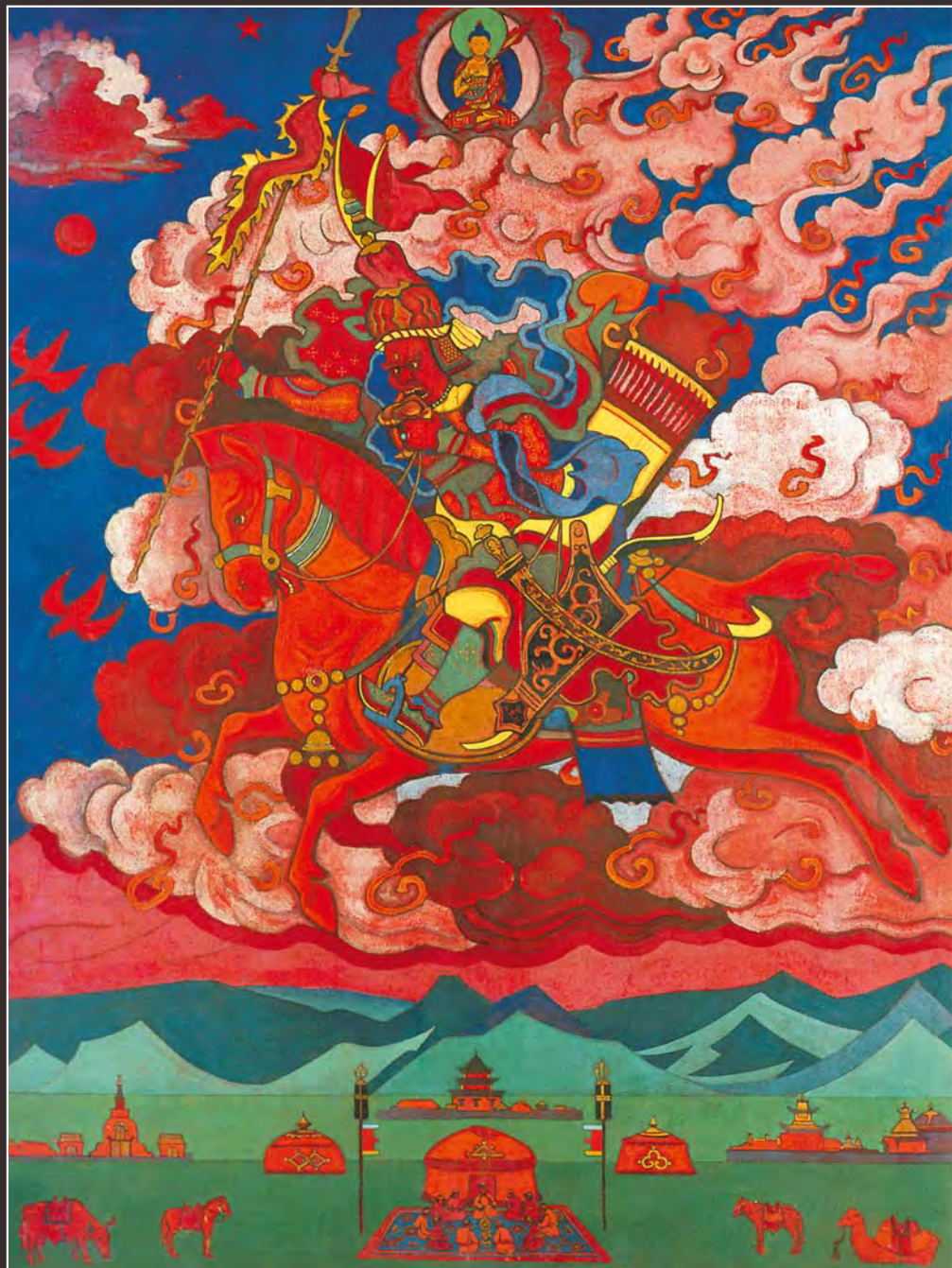
117. Н.К. Рерих. Грядущее (Великий Всадник). 1927