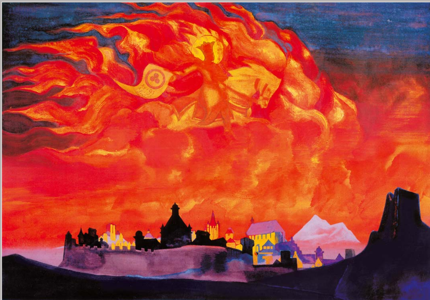
123. Н.К. Рерих. София-Премудрость. 1932