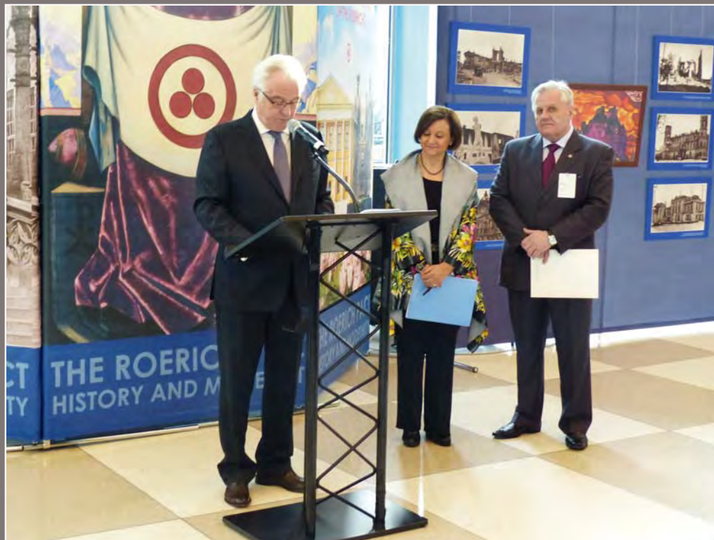
130. Выступление Постоянного представителя РФ при ООН В.И. Чуркина на открытии выставки «Пакт Рериха. История и современность». Штаб-квартира ООН в Нью-Йорке, США. 15 апреля 2015 года