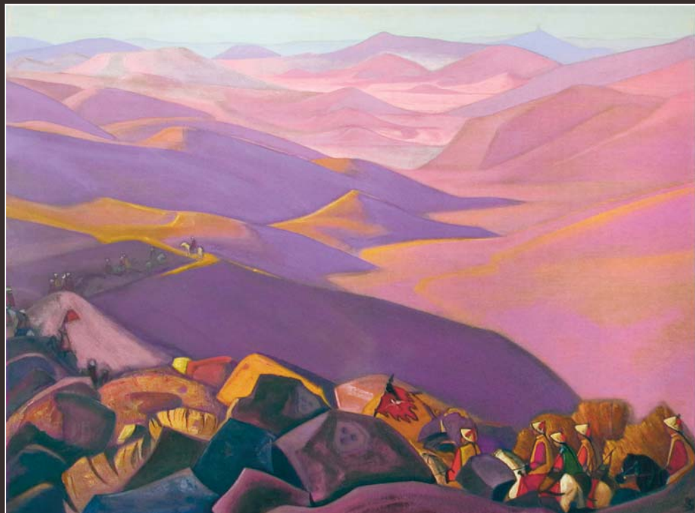
118. Н.К. Рерих. Монголия (Поход Чингиз-хана). 1937