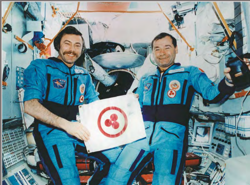
129. Космонавты А.Н. Баландин и Г.М. Стрекалов со Знаменем Мира на борту орбитального пилотируемого комплекса «Мир». Август 1990 года