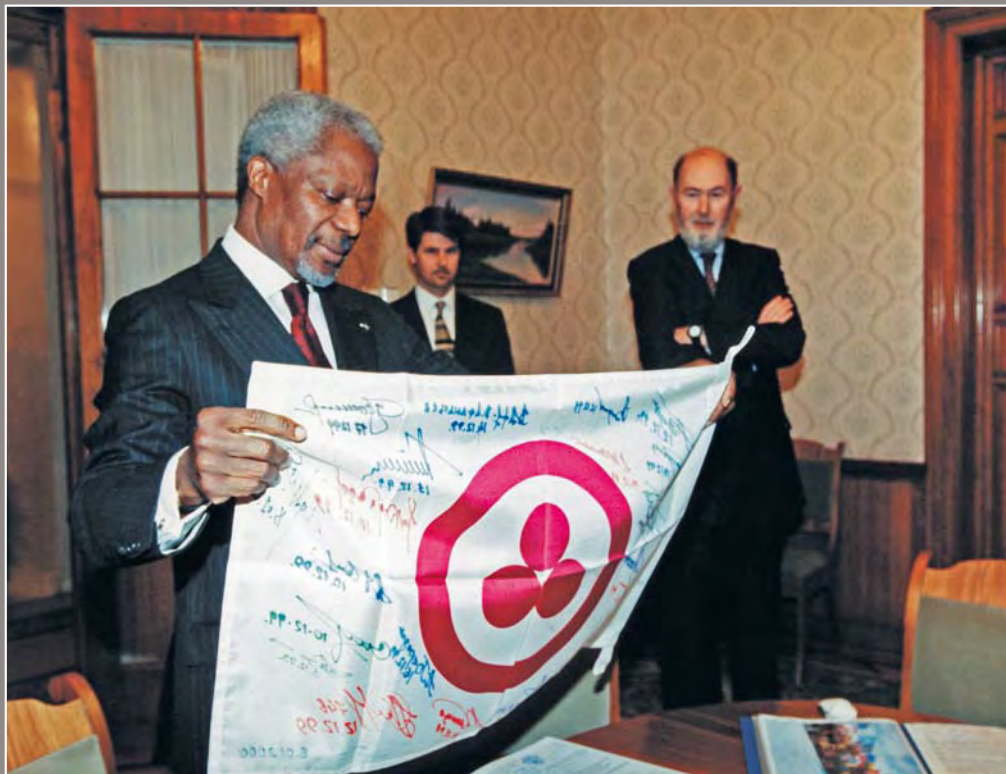
124. Генеральный секретарь ООН Кофи Аннан со Знаменем Мира, побывавшим на Южном полюсе Земли и переданным ему в дар от Международного Центра Рерихов, экспедиционного центра «Арктика» и проекта «Знамя Мира». Москва. 28 января 2000 года