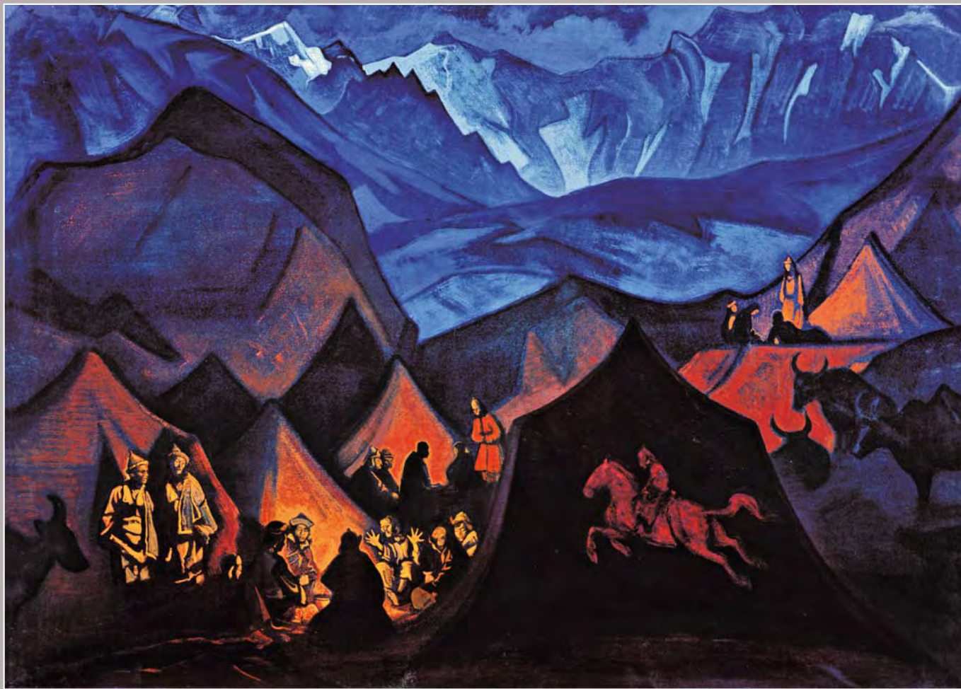
116. Н.К. Рерих. Шепоты пустыни. Из сюиты «Майтрейя». 1925