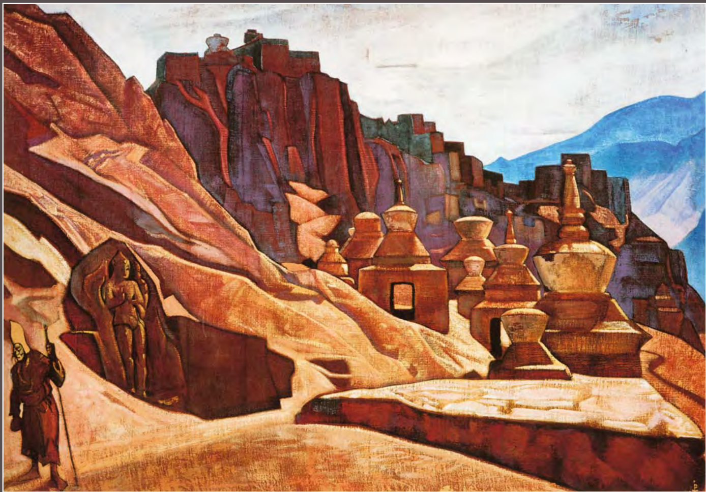
113. Н.К. Рерих. Твердыни стен. Из сюиты «Майтрейя», 1925