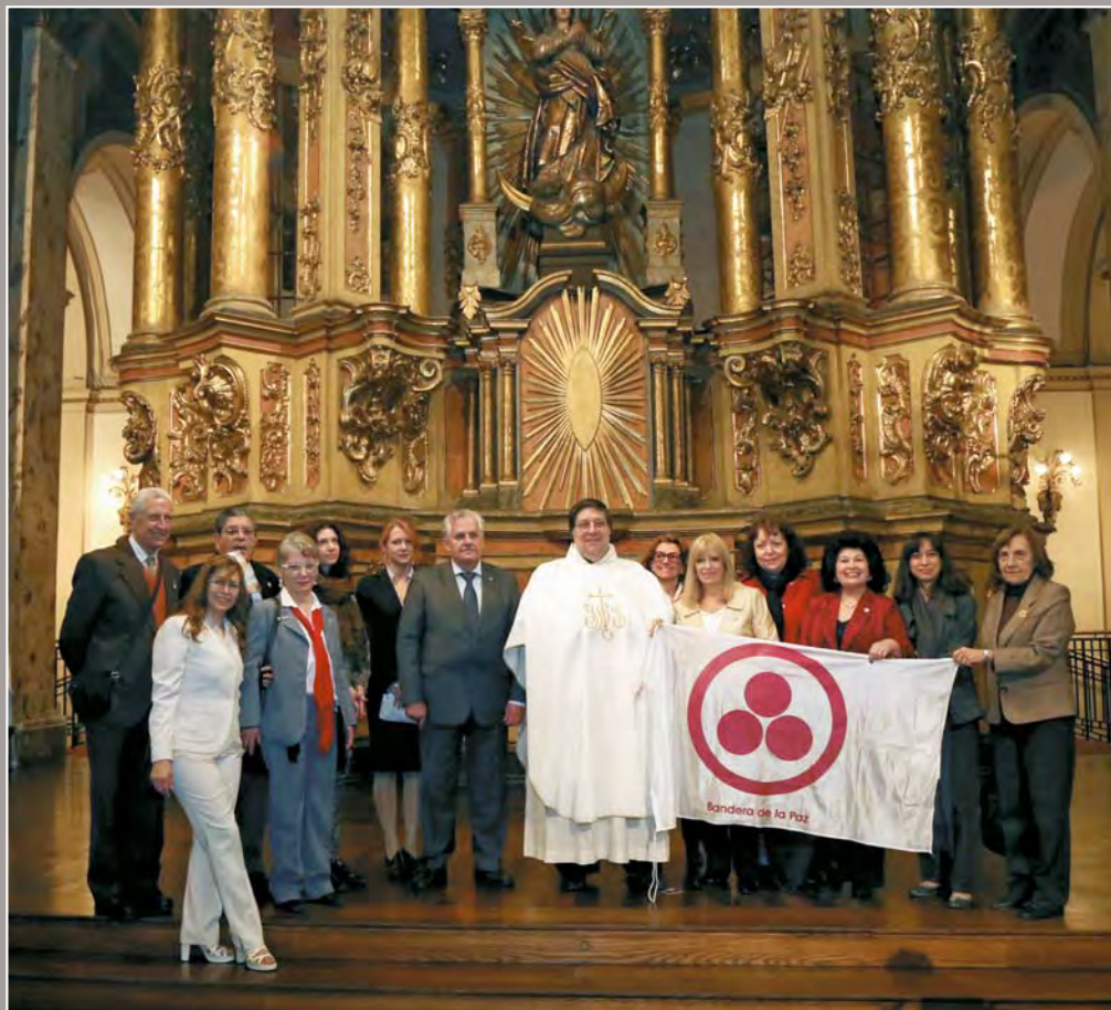
126. Освящение Знамени Мира в кафедральном соборе Буэнос-Айреса. Аргентина. 20 сентября 2013 года