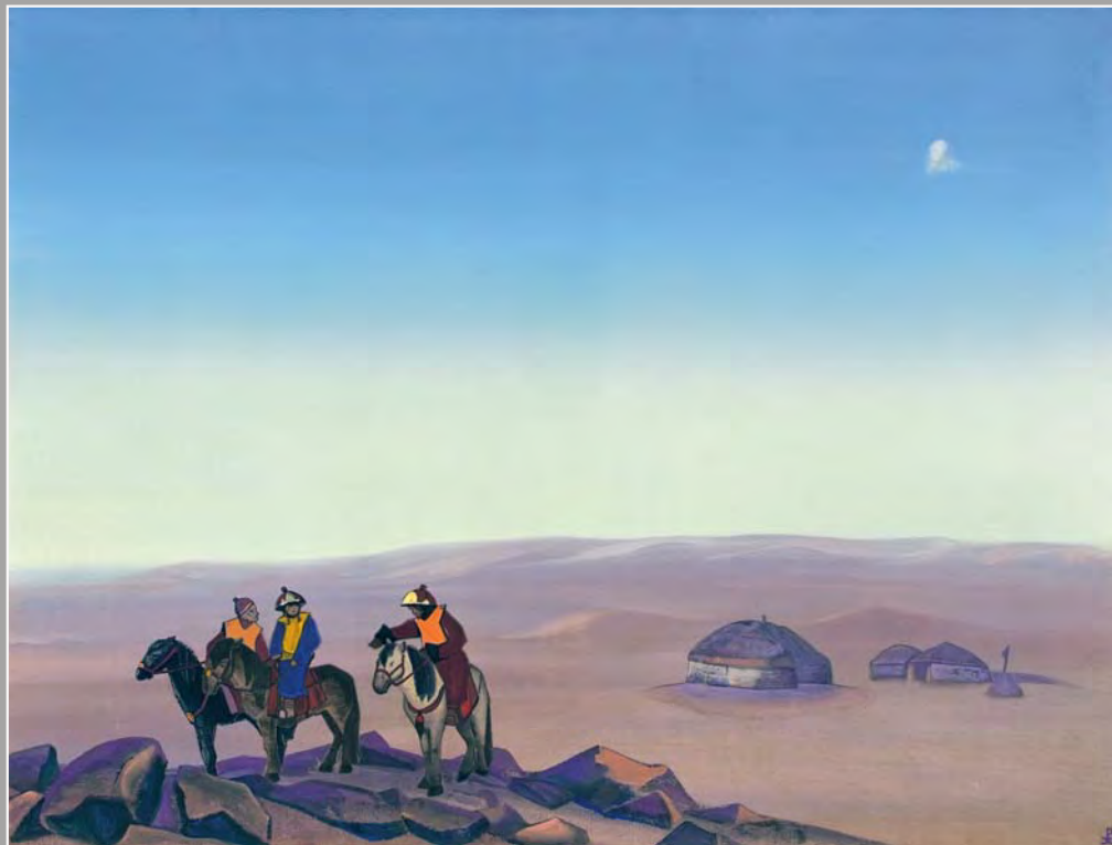
119. Н.К. Рерих. Монголия. 1938