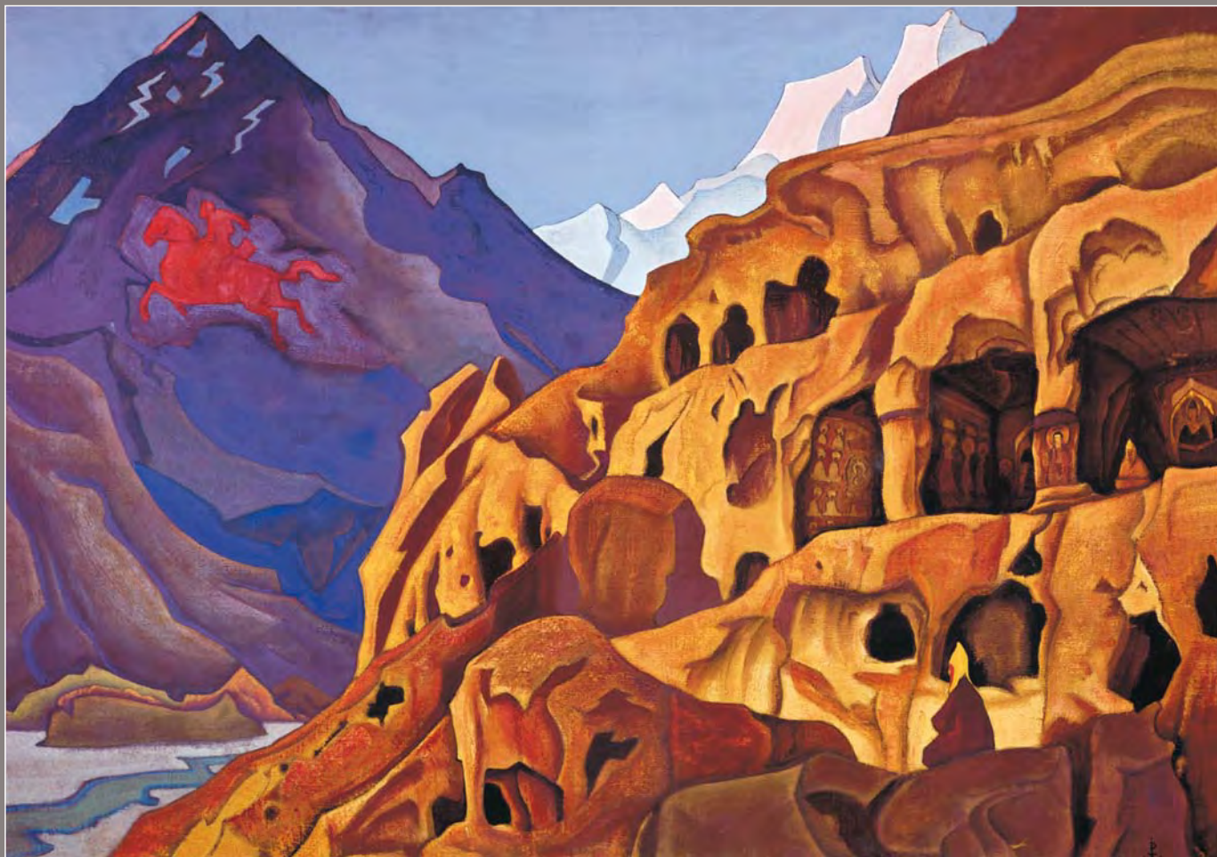
114. Н.К. Рерих. Мощь пещер. Из сюиты «Майтрейя». 1925