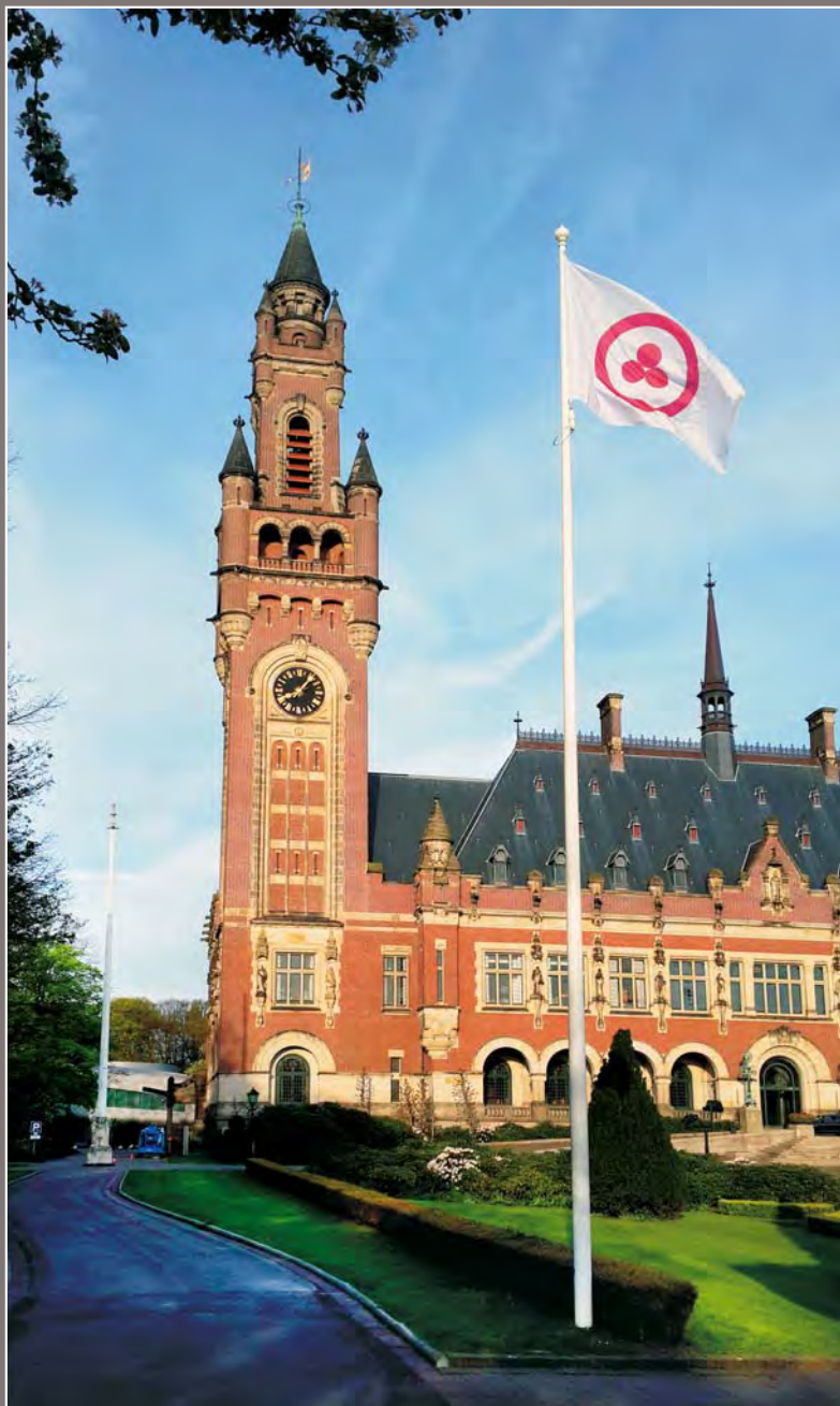
128. Поднятое Знамя Мира перед Дворцом Мира в Гааге. Нидерланды. Апрель 2014 года