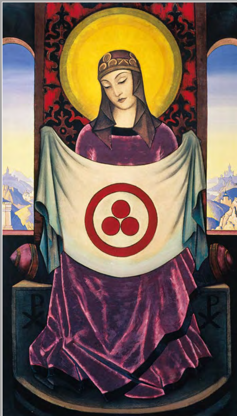
120. Н.К. Рерих. Мадонна Орифламма. 1932