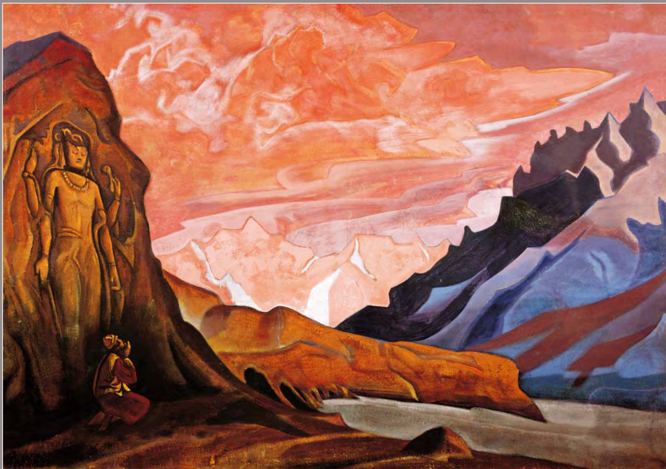
111. Н.К. Рерих. Майтрейя Победитель. Из сюиты «Майтрейя». 1925