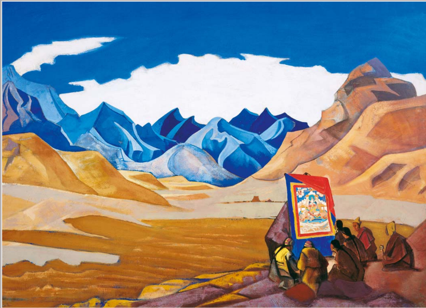
115. Н.К. Рерих. Знамя грядущего. Из соиты «Майтрейя». 1925